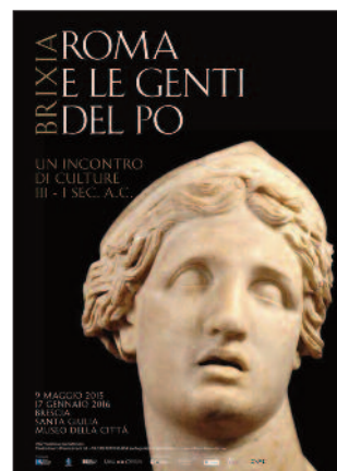
La locandina della mostra bresciana Roma e le Genti del Po.