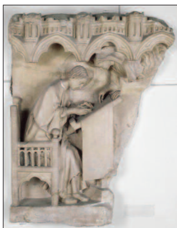
San Matteo Evangelista scrive sotto dettatura dell'angelo, proveniente dalla cattedrale di Chartres.

Mostra "Una breve storia dell'avvenire", che in un percorso affascinante presenta i rapporti tra l'indi-