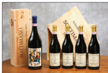
La produzione di vini Barbaresco dell'Azienda Agricola Sottimano.