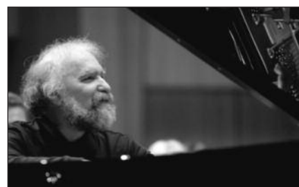
Il pianista romeno Radu Lupu.

Radu Lupu interpreta Mozart: è questo il tema del concerto più atteso nel mese di dicembre per la stagione dell'Orchestra dell'Accademia Nazionale di Santa Cecilia, diretta per l'occasione da Fabio Luisi. Radu Lupu interpreta al pianoforte il Concerto per pianoforte n. 21 K 467 di Mozart. In programma anche la Sin-