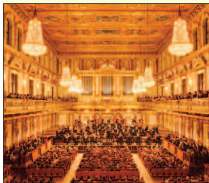
La Kammerorchester Wien Berlin nella Sala d'Oro del Musikverein.