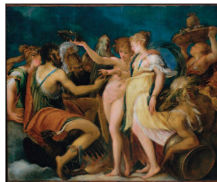
Andrea Schiavone, Nozze tra Cupido e Psiche – 1550 circa.