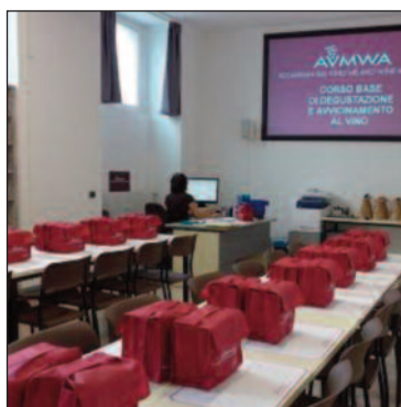
La sede milanese dell'Accademia del Vino.