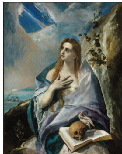
El Greco, Maddalena penitente .

Mostra "Da Raffaello a Schiele. Capolavori dal Museo di Belle Arti di Budapest", che si presenta come un'occasione unica per ammirare un'accurata selezione di opere del più importante museo della capitale ungherese e per fare un viaggio nella storia dell'arte dal Cinquecento al Novecento. Raffaello, Tintoretto, Durer, Velasquez, Rubens, Goya, Murillo, Canaletto, Manet, Cezanne, Gauguin e tan-