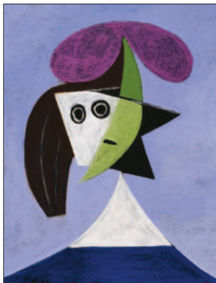
Pablo Picasso Donna con cappello (Olga) , 1935.

Mostra "Ritratti di Picasso", organizzata con la collaborazione del Museo Picasso di Barcellona. Sono esposte oltre 75 opere, che coinvolgono vita personale ed evoluzione artistica di uno dei più grandi maestri del Novecento. www.npg.org.uk