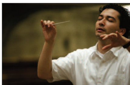
Il direttore d'orchestra colombiano Andrés Orozco-Estrada.

Concerto dei Wiener Symphoniker diretti da Andrés Orozco-Estrada. In programma musiche di R. Strauss e Rossini.