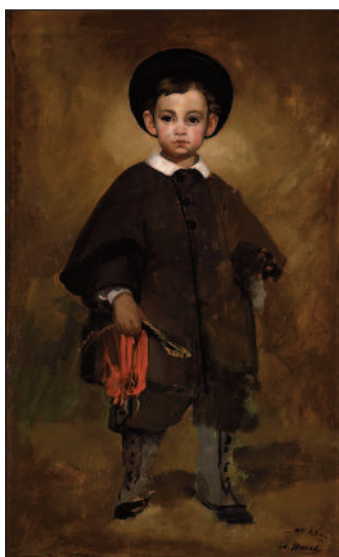
Edouard Manet, Ritratto di un bambino della famiglia Lange , 1861 circa.

Mostra "Storie dell'impressionismo": i grandi protagonisti da Monet a Renoir, da Van Gogh a Gauguin. Esposti 120 capolavori provenienti da musei e collezioni private di tutto il mondo (quasi tutti dipinti, ma anche fotografie e incisioni a colori su legno) in un percorso eccezionale, attraverso nove sezioni che collocano le opere nel contesto storico.