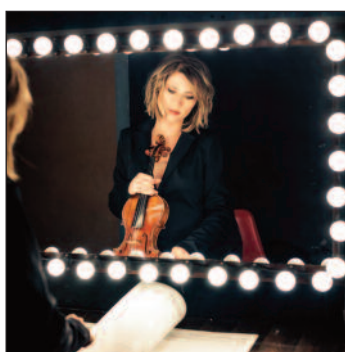
La violinista georgiana Lisa Batiashvili

Tournée della Chamber Orchestra of Europe con due appuntamenti musicali. Nel primo sono protagonisti anche Antonio Pappano e Lisa Batiashvili, nel secondo ad accompagnare l'orchestra è Leonidas Kavakos. In programma musiche di vari autori.