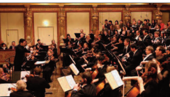
La Tonkünstler Orchestra of Lower Austria, storica orchestra fondata agli inizi del Novecento.

Prima edizione del Festival del Musikverein. Una delle più celebri sale da concerto del mondo ospita per oltre un mese un nuovo festival incentrato sui compositori Debussy, Bernstein e Beethoven, con circa 60 concerti. Si prevede la