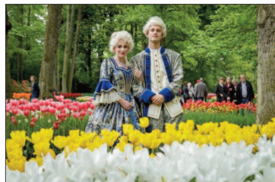
Personaggi in costume per il Classical Music Festival Romance al Keukenhof.

Si rinnova la tradizione del parco floreale di Keukenhof, una delle