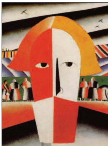
Kazimir Malevich, Testa di contadina - 1928-1929.

Mostra "Revolutija. Da Chagall a Malevich, da Repin a Kandinsky", che ospita circa 70 opere di artisti del calibro di Marc Chagall, Wassily Kandinsky, Nathan Altman, Natalia Goncharova, Kazimir Malevich, Valentin Serov e Alexandr Rodchenko, con lo scopo di narrare lo sviluppo dei movimenti culturali nati in Russia all'inizio del '900 e i grandi