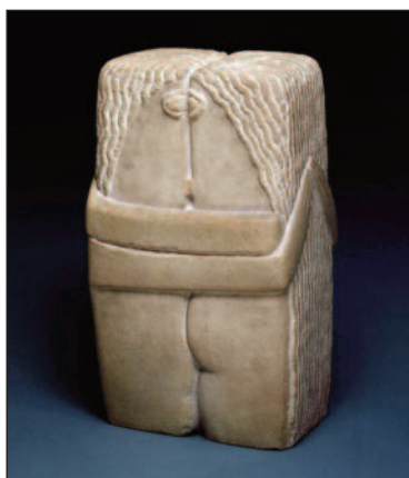
Konstantin Brancusi, Il bacio – 1916.

grandi pittori a cavallo tra Ottocento e Novecento nel loro periodo di massima espressione artistica. www.palazzorealemilano.it