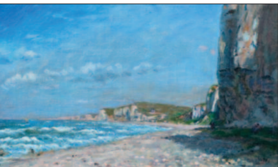
Adolphe-Félix Cals, Scogliere, dintorni di Dieppe - 1862.

Mostra "Luci del Nord. Impressionismo in Normandia", con più di 70 significative opere che raccontano la fascinazione degli artisti per la Normandia, territorio che diventa microcosmo naturale generato dalla forza della terra, del vento, del mare e della nebbia. I dipinti provengono dall'Association Peindre en Normandie di Caen, dal Museo del Belvedere di Vienna, dal Musée Marmottan di Parigi e dal Musée Eugène Boudin di Honfleur e recano la firma di autori come Monet, Renoir, Bonnard, Boudin, Corot, Courbet, Daubigny, Dufy, Gericault e altri ancora.