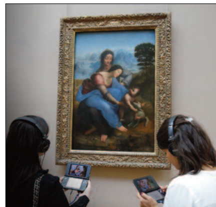
Leonardo da Vinci, Madonna con Bambino e Sant'Anna.

Mostra "Leonardo Da Vinci" , straordinaria retrospettiva in omaggio al quinto centenario della morte del sommo artista, che permette di ammirare numerosi capolavori leonardeschi, tra dipinti e disegni. La prenotazione dei biglietti è obbligatoria.