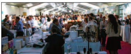
La Gourmet Arena allestita sulla Passeggiata lungo Passirio di Sissi a Merano.

28esima edizione del Merano Wine Festival, con oltre 950 case vitivinicole, tra le migliori in Italia e nel mondo, e più di 120 artigiani del gusto.