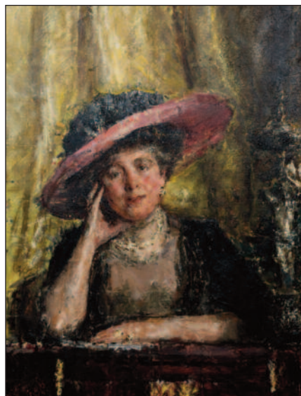
Antonio Mancini, Lady Phillips – 1909.

PALAZZO SARCINELLI fino al 2 febbraio 2020