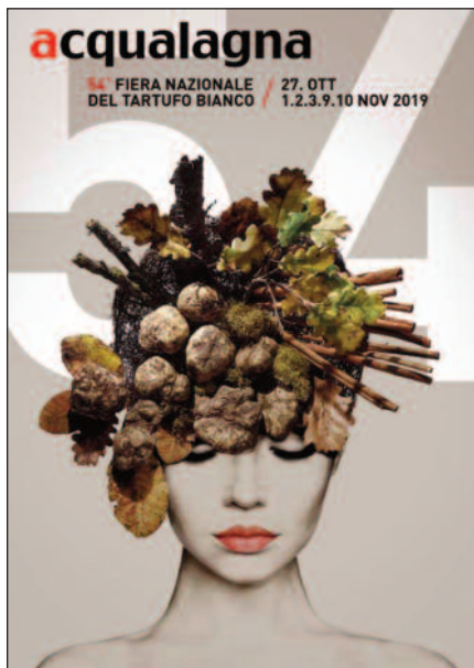
Il manifesto della Fiera Nazionale del Tartufo Bianco 2019.

Ultimi appuntamenti della 54esima edizione della Fiera Nazionale del Tartufo di Acqualagna, che coinvolge tutto il centro storico della località marchigiana, con degustazioni guidate e 80 stand enogastronomici. www.acqualagna.com